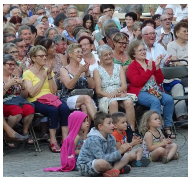
550 spectateurs sont venus applaudir le groupe Fusion andino latine.