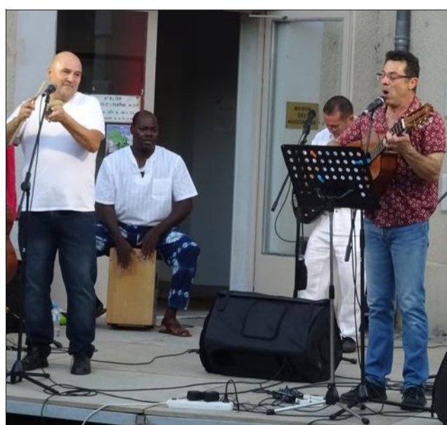
Les rythmes de salsa et flamenco n'ont pas laissé le public indifférent.

Pour ce 3 e Vendredi de l'été, l'ambiance était sud-américaine sur l'esplanade du jardin de ville. 550 personnes sont venues applaudir Fusion andino latine et se sont laissées rapidement emporter par cette musique entraînante.